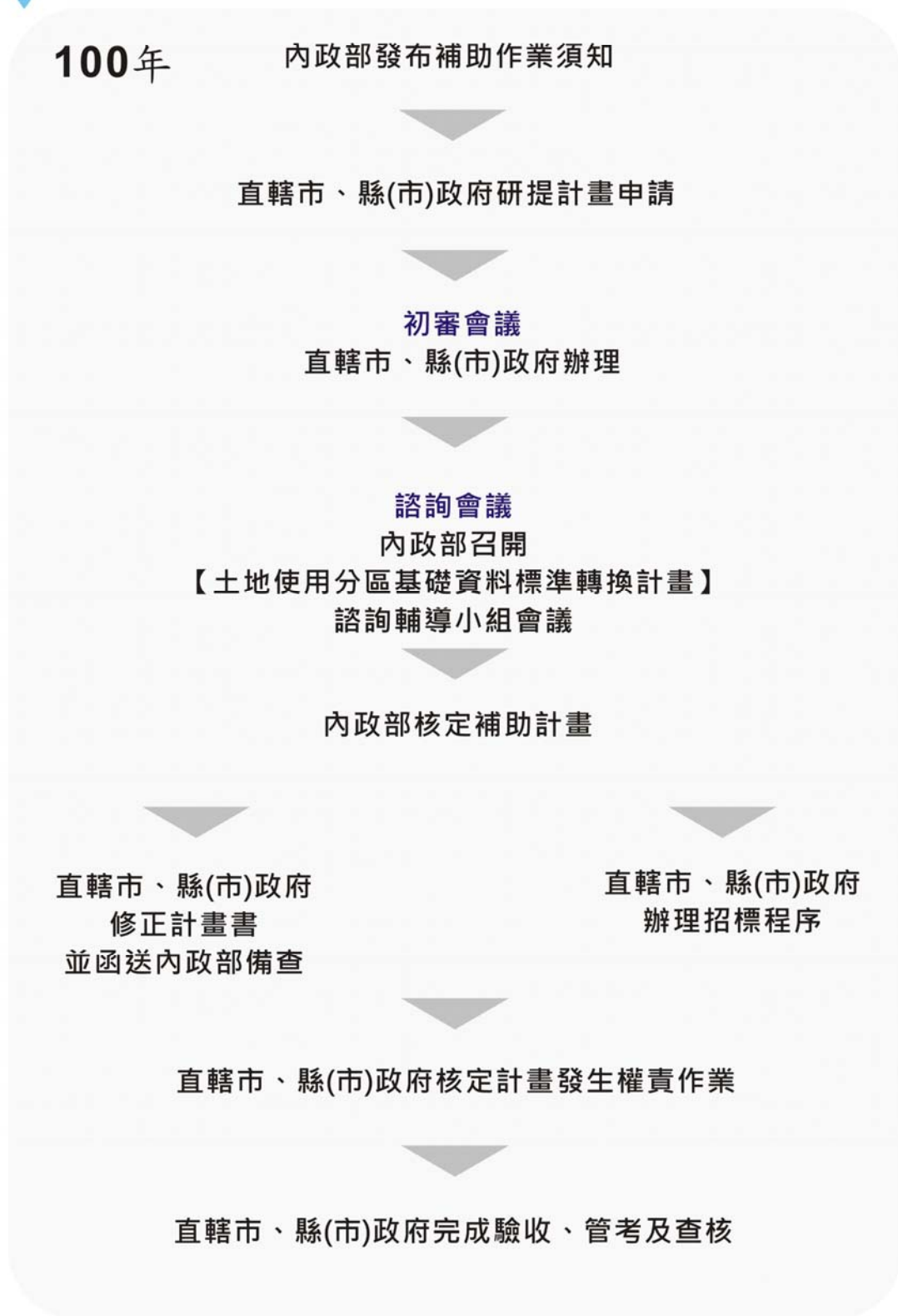
圖 1-4 補助計畫申請程序與流程說明圖