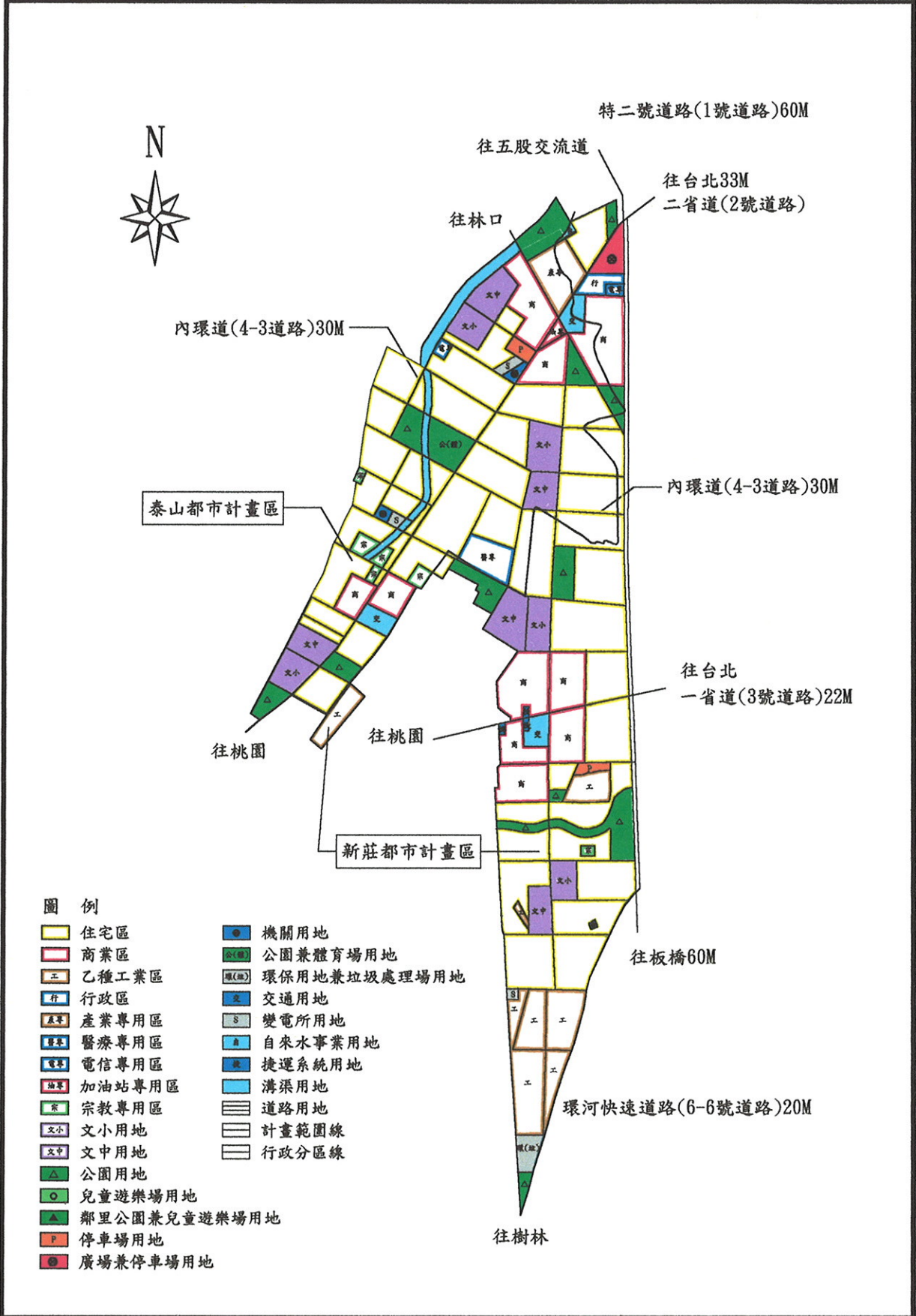
圖三 擬定泰山都市計畫(塭仔圳地區)(三期防洪拆遷安置方案) 細部計畫配合變更主要計畫示意圖