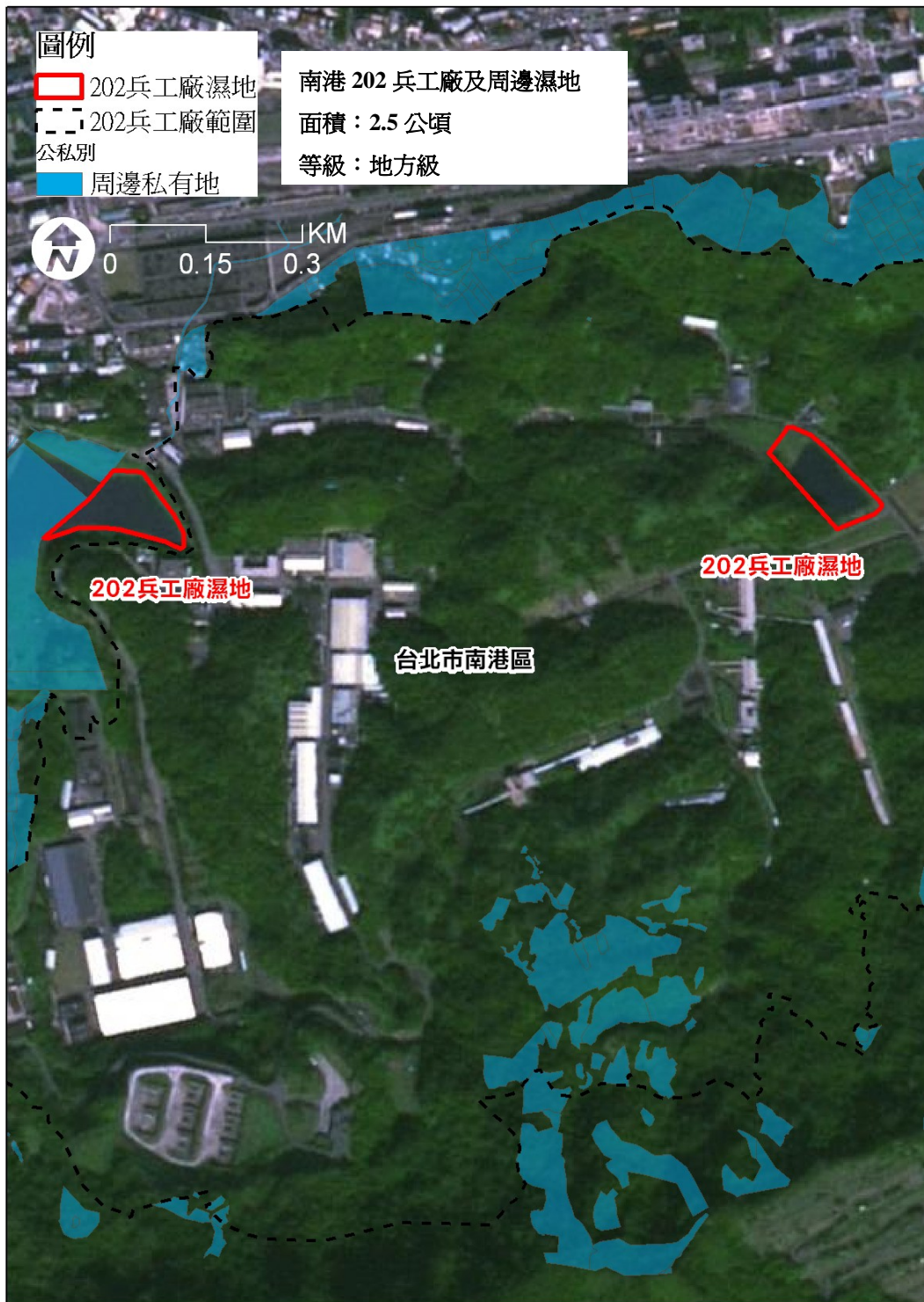
附圖三 南港 202 兵工廠及周邊濕地