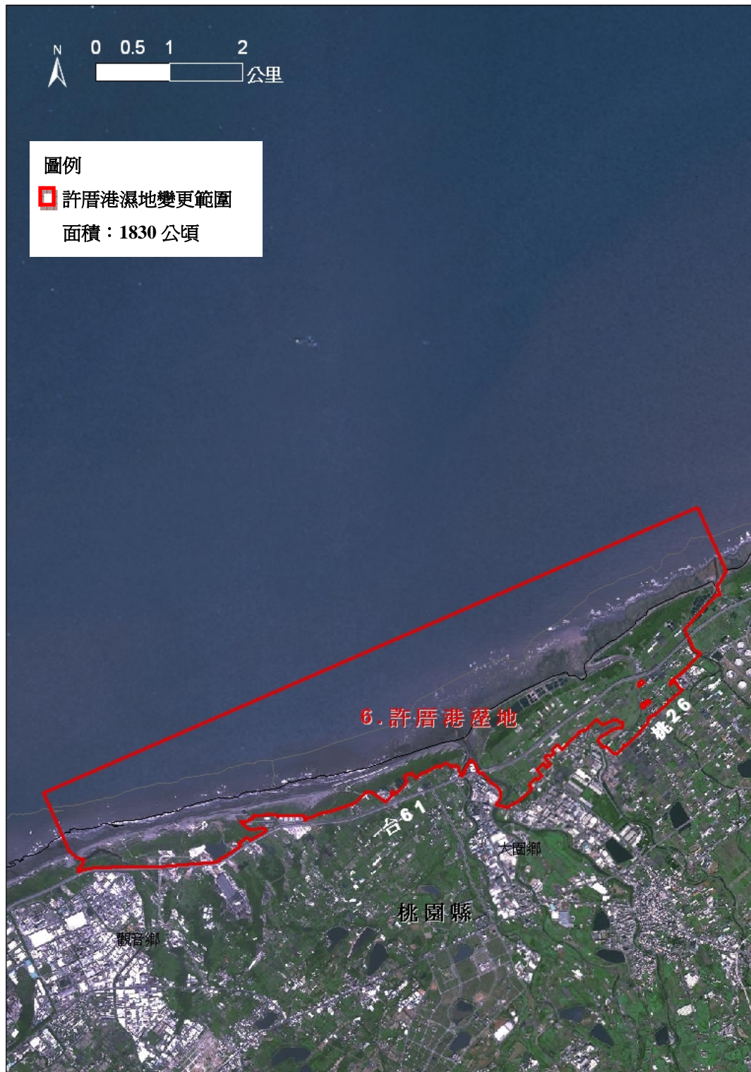
附圖一 許厝港濕地變更範圍圖